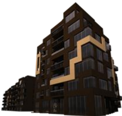
блок за живеене

бавя (задържам, възпирам да се извърши нещо) - бавя (гледам дете)