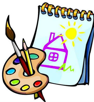
блок за рисуване