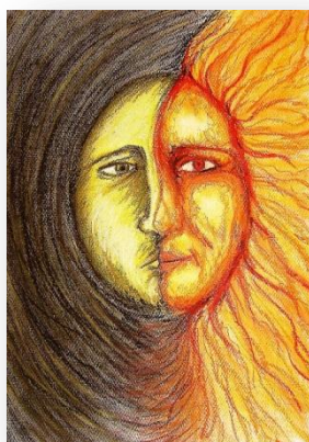
нощ - ден