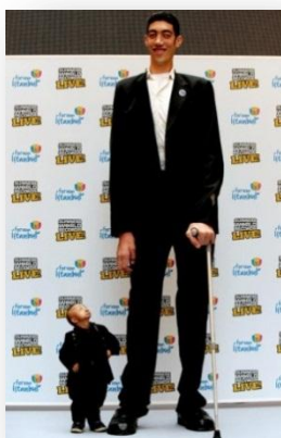
нисък - висок

Антоними - думи различни по звуков състав и противоположни по значение ( болен - здрав, силен - слаб ).